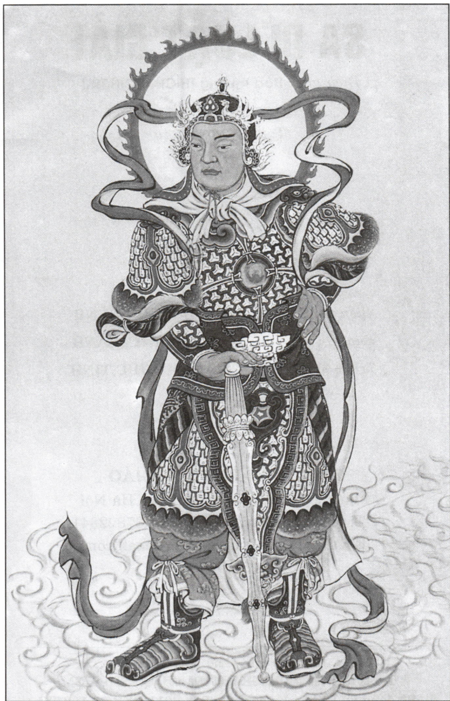
NAM MÔ HỘ PHÁP TẠNG BỒ TÁT